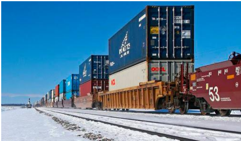
حمل و نقل ریلی

نرخ باربری و قیمت حمل بار به روش هوایی می‌تواند نسبت به دیگر گزینه‌ها بیشتر باشد و محدودیت حمل بار به لحاظ وزن بار، نوع بار و جنس آن از دیگر عوامل محدودکننده‌ی حمل و نقل هوایی است.