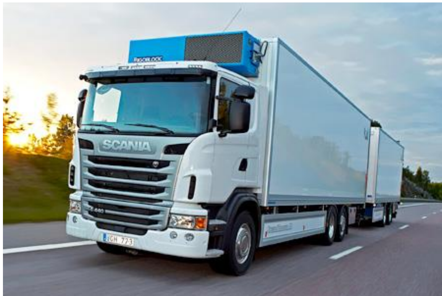
حمل و نقل زمینی با کامیون

از مزایای حمل و نقل دریایی می‌توان به هزینه‌ی حمل کالا و سرعت جابه‌جایی حجم بالای کالا اشاره کرد. با توجه به موقعیت کشور مبدأ یا مقصد می‌توان برای جابه‌جایی بار و یا ارسال آن از باربری دریایی استفاده کرد. صاحبان کالا و شرکت‌های تجاری با توجه به قیمت و نرخ باربری مناسب حمل و نقل دریایی، بار و محموله‌ی خود را از طریق حمل و نقل دریایی ارسال می‌کنند که اکثر جابه‌جایی‌ها در زمینه‌ی تجارت بین‌الملل از طریق دریا صورت می‌گیرد.