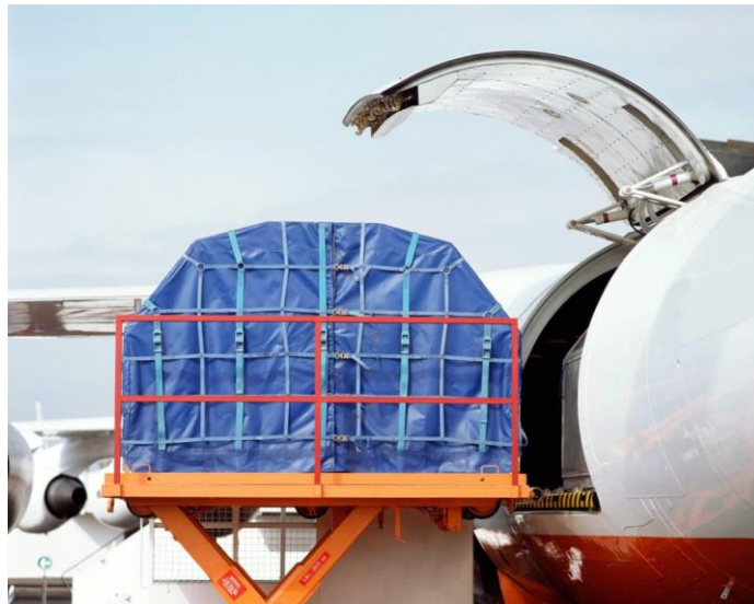
روش استفاده از حمل و نقل هوایی

نرخ باربری در حمل‌ونقل زمینی دارای کمترین نرخ نسبت به حمل‌ونقل‌های دیگر است. این نوع حمل برای بسیاری از کالاها و محموله‌ها هم از نظر قیمت و هم از نظر سرعت بسیار مناسب هست.